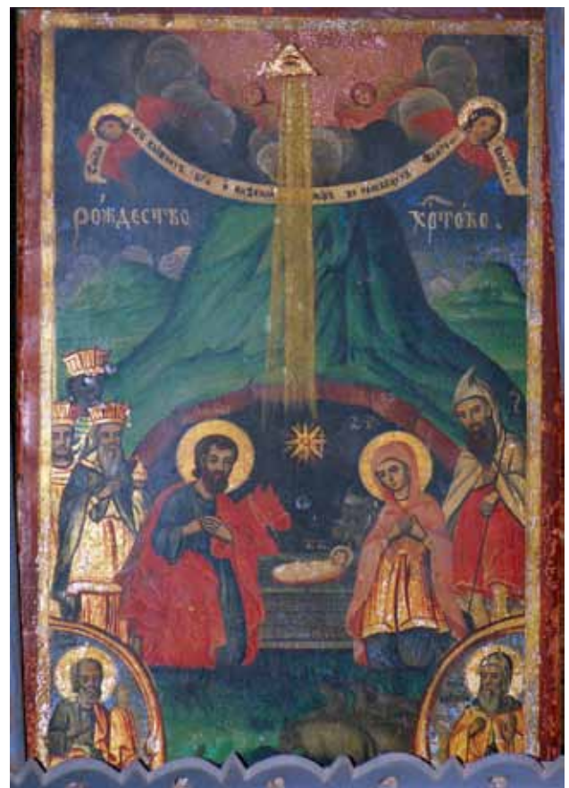
Сл. 3. икона, Христѡво Раѓане, црква Св. Никола, с. Брждани, 1874 г., авѡор Аврам Дичѡв

Св. Димитрија како го прободува царот Калојан (сѣтѣи димїтрїи) (сл. 11)