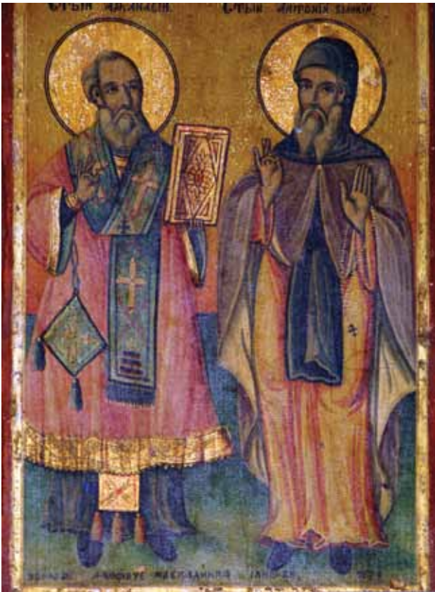
Сл. 6. икона, св. Анѳониј и св. Аѳанасиј Александриски, црква Св. Никола, 1874 г., автор Аврам Дичов

Во горната зона, во конхата на нишата е насликан Христос Цар и Велики Архиепископ (црѣ, црѣмѣ Великий архіерей) во темнокафеав сакос и круна на главата во облик на византиски каналаксион. Христос со двете раце ги благословува предложените дарови, трите лепчиња на дискос и путирот со вино поставени на светиот престол пред него.