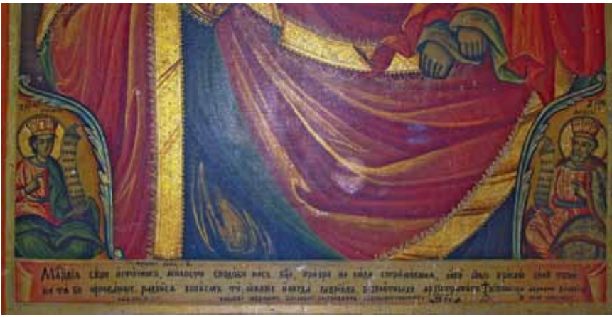
Сл. 2. Тройар Богородичин, глас виѡри, икона Богородица со Христѡс, деѡшал

Глава въ вѣшнихъ Бѣгъ и наземли мѣръ во человекѣхъ благоволѣнїе. Во долниот дел на иконата се претставени допојасјата на св. Никола (сѣтѣи нѣколѣи) претставен во хитон, химатион и затворен свиток во рацете, а на спротивната страна е св. Антониј (сѣтѣи анѣонїа) во монашка одежда, со кукул на главата и крст во десната рака.