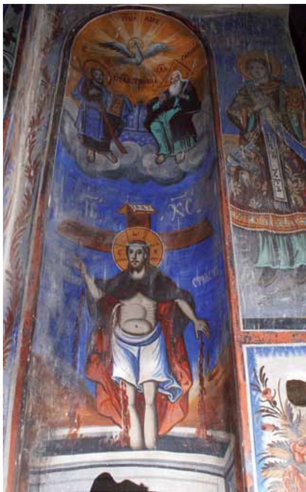
Сл. 12. фрескоживојис на источниот ѕид од пројезисој, црква Св. Никола, с. Брждани, 1874 г., автор Аврам Дичов

Ако внимателно ги анализираме деловите на овие иконографски целини, како натписите и сигнатурите што ги објаснуваат, се доаѓа до самата текстуална предлошка што послужила Дичо Зограф да ја обликува оваа сложена тема.