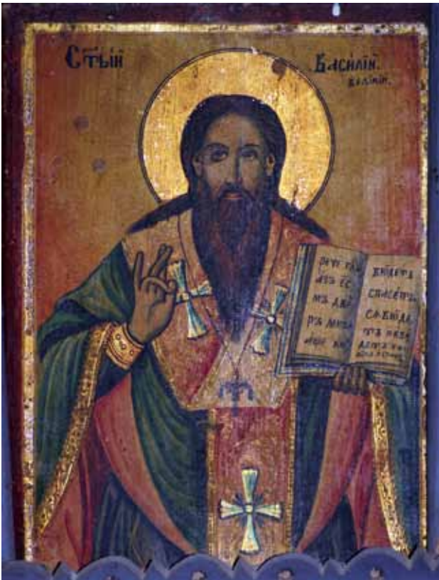
Сл. 4. икона, св. Василиј Велики, црква Св. Никола, с. Бржани, 1874 г., автор Аврам Дичов

Во горниот дел од нишата во конхата е претставена св. Троица (СѢТА трѡица) Бог Отец, со бела долга брада и коса, сигниран како ГѢДЪ САВАШѢЪ со нимб во форма на триаголник, со десната рака благословува, а во левата носи краток жезол. До него е Исус Христос (ГѢ ХЪ С), кој во десната рака го носи големиот голготски крст, а во левата затворено евангелие. Меѓу нив е претставена вселената насликана во форма на тркалезна сфера со мноштво ѕвезди. Во средината над нив е светиот Дух (СѢТИИ ДЪХЪ) насликан како гулаб со крстест нимб околу главата.