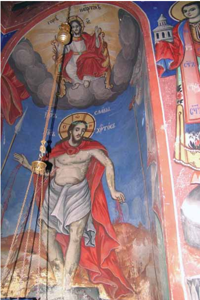
Сл. 15., фрескоживопис во нишаата на пророците во црквата на Св. Георѓи, манастир Рајчица, 1848/52 г., автор Дичо Зограф

епископ на градот Отранто, кој ги пишува тропарите на првите четири песни. Во прво време читан само на службите на Велика Сабота, еднаш на утрената, а вторпат во текот на предпасхалното бдение, дури кон средината на XIV век, со реформите во богослужението и литургискиот ритуал што ги спроведува цариградскиот патријарх Филотеј Кокинос во својот познат Дијатаксис (Διάταξις), овој тропар влегува во чинот на Светата литургија. 19 Него свештеникот го говори на крајот од службата на проскомидијата, при отпустот и подоцна по Великиот Вход,