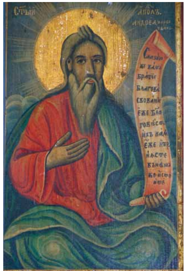
Сл. 7. икона, св. аѳосѣол Андреја, црква Св. Никола, с. Брждани, 1874 г., автор Аврам Дичов

Живописот на Аврам Дичов во црквата Св. Никола во Брждани содржи неколку интересни тематски и иконографски остварувања.