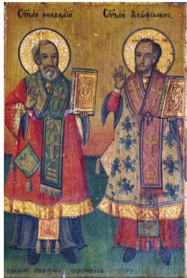
Сл. 5. икона, св. Никола и св. Теофилакиј, црква Св. Никола, с. Брждани, 1874 г., автор Аврам Дичов

Меѓу александрискиот архијереј и столбот, симболот на чесната трпеза, е насликана адската глава, која го голта еретикот Ариј, над чија глава е испишан подолг текст: ѡриѡ вѡзѡмниѡ перѡагѡ начѡлѡника ѡ еретѡческѡѡ, трѡѡклѡти, ѡнѡтеѡа.