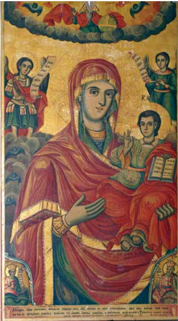
Сл. 1. икона, Богородица со Христѣос, црква Св. Никола с. Брждани, 1874 г., автор Аврам Дичов

старите престолни икони од првобитниот иконостас, сликани од Дичо, биле повлечени и поставени во олтарниот дел од црквата а само шесте икони со претстави на апостолите нашле место во новата програма на иконостасот во редот над архитравот.