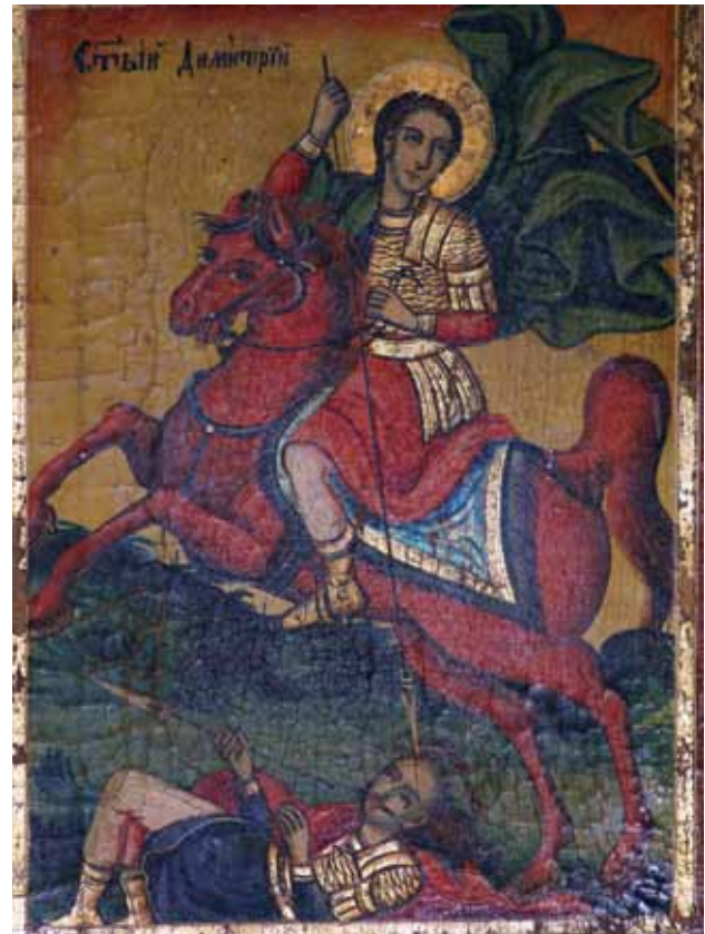
Сл. 11. икона св. Димитрија, црква Св. Никола, 1874 г., авѣиор Аврам Дичов

Како други карактеристични места од иконописот на Аврам би ја издвоиле претставата на св. Никола на иконата на Христовото раѓање, каде што овој светец е насликан во бел хитон, со свиток во раката, без епископската одежда, фелон и омофор.