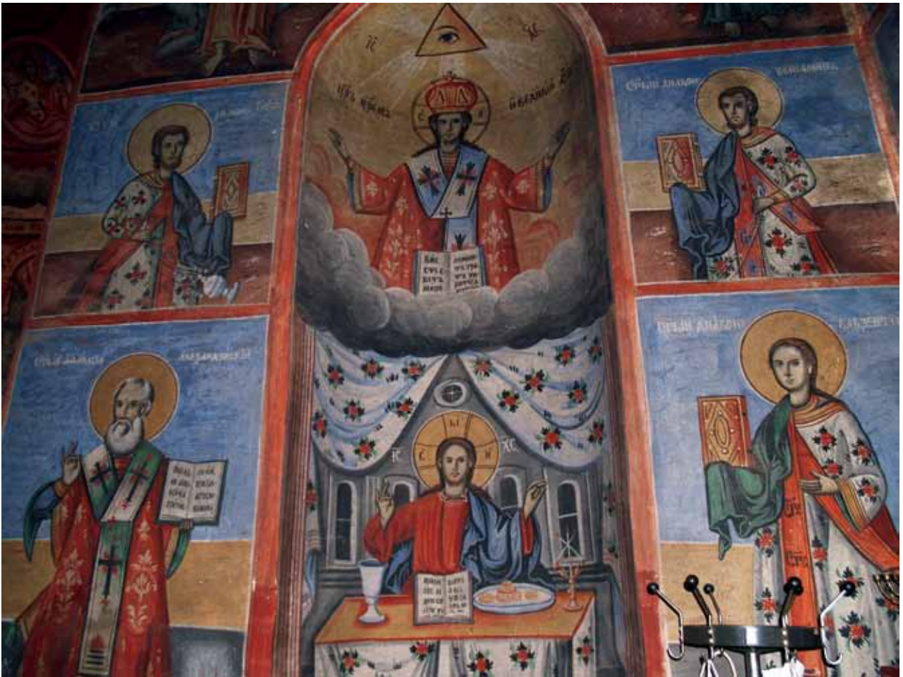
Сл. 16. фрескоживојис во нишајта на ѓакониконот на црквата Св. Никола во Вевчани, 1879 г., автор Аврам Дичов.

тоар на татко му Дичо, кој претходно ја слика во нишата на ѓакониконот во манастирот Рајчица 1848/52 г.